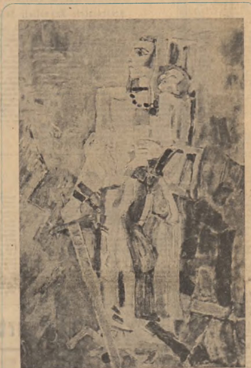
Traian Brădean: „Victorie”