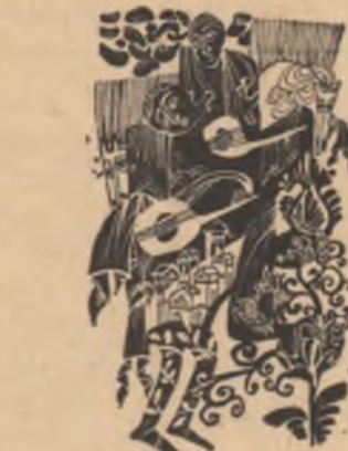
Desene de Mihai Gheorghie

Am venit acasă mirosînd a vin mi-am sărutat bărbatul, i-am povestit laptele zilei.