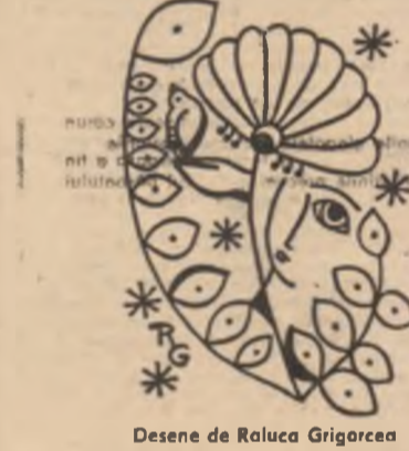
Desene de Raluca Grigorec