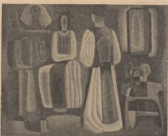
Gheorghe Șara: „Interior țărănesc”