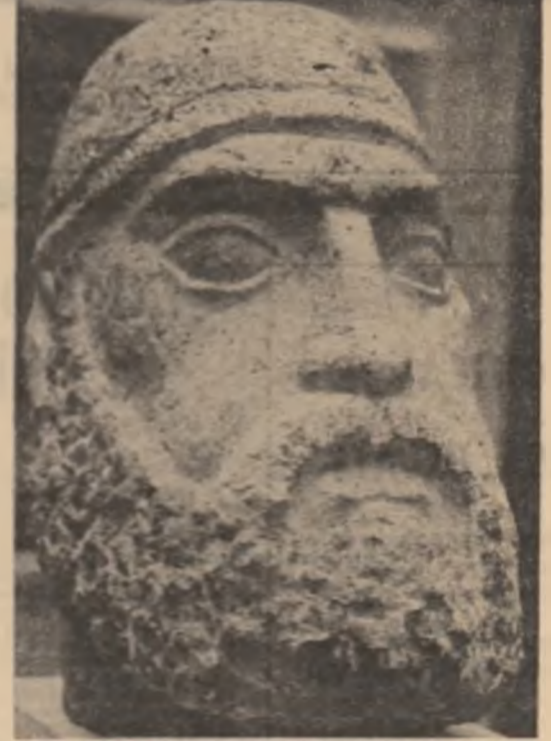
Ernest Kovacs: «Burebista»

S-o spunem o dată și încă o dată: literatura nu este o simplă parafrază a istoriei. Chiar cu riscul de a abosi prin acumularea comparativă, vorbim în mîntu biblic — alt de straniu — al lui Iacob cu ingerul: binecuvîntarea este simțită după o noapte întregă de așteptare lupte, într-un trup. Tot astfel istoria se cere a fi dominată pentru a-și descoperi semnificațiile adînci, pentru ca aurul istoriei să se preschimbă în aur estetic.