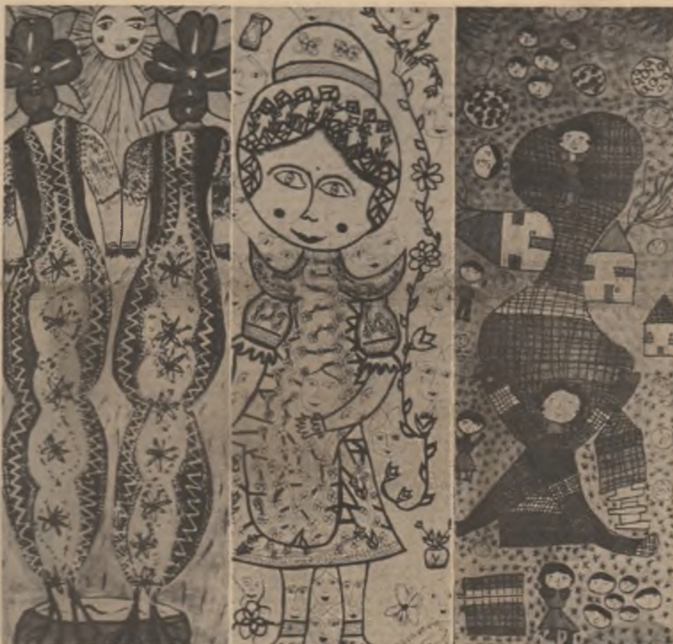
Trei lucrări din expoziția CULORILE VULTUREȘTIULUI, deschisă la sala Dolles