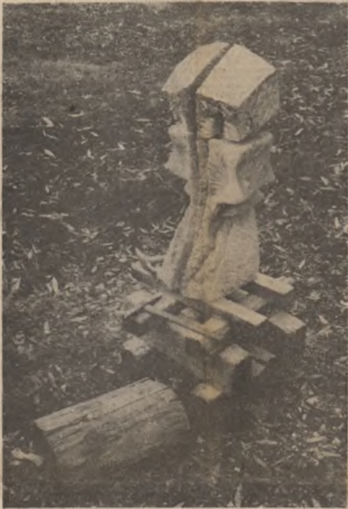
Nicopetre: „Umbra” (În paginile 3, 4 și 5 alte lucrări ale artistului)