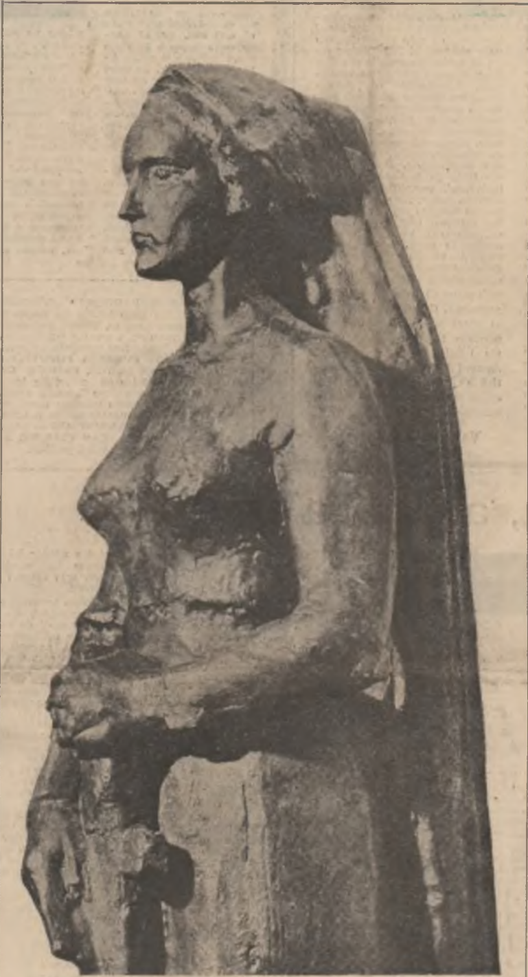
JURNAL DE POET

O frumusețe cu obrsia în gândul, fața noastră. În spiritul nostru revoluționar. Luceafărul