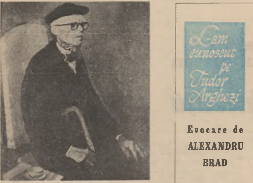
Ulei de Corneliu Baba