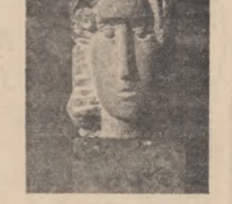
Iorga Iliopolis: „Oana”

Griul fierbinte de pe arii strîns Și-i potrivește chipul în cōmară Înbia piine-l strîng pe eller Să țînc loc de soare peste țoră