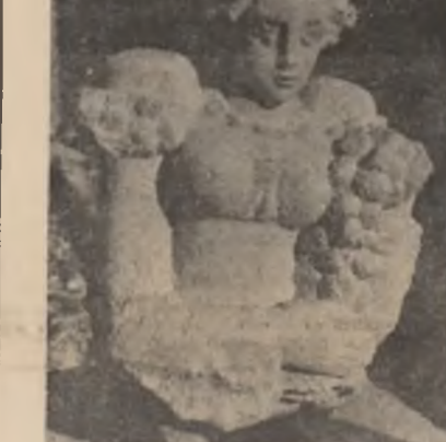
Iorga Iliopolis: „Podgoricancă”