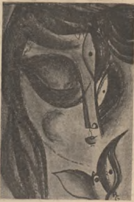
Desen de Raluca Grigoreca