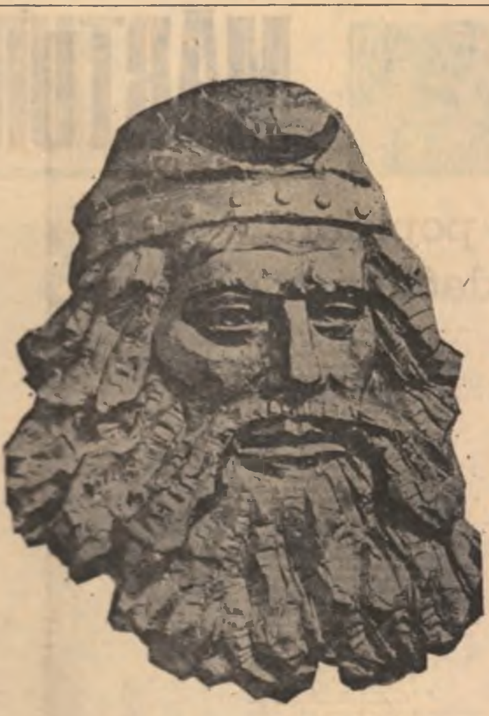
Burebista - sculptură de Paul Marcea

De coajă numele lui se desbracă asemenea ghindei în echil înveit de țară al vulturului orb răsos dintr-o dinastie pierdută într-o altă de ciudată țară de sine.