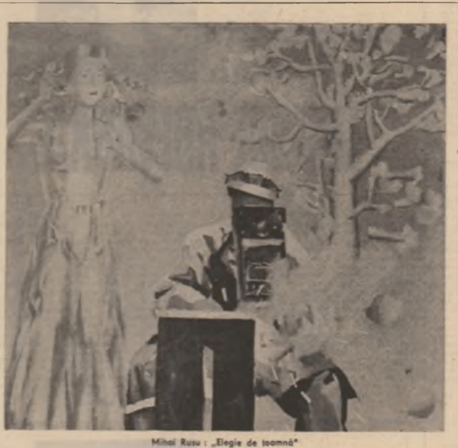
Mihai Ralea „Elegie de toamnă”