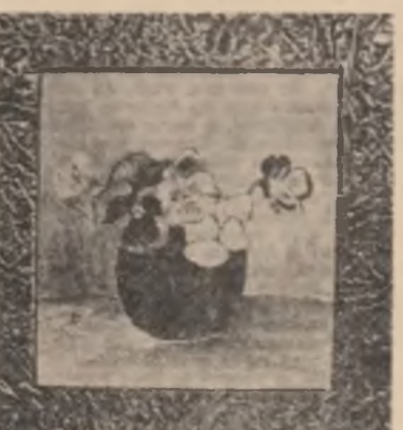
Ligia Boiangiu-Mihăilescu: „Flori”

O foaie albă acoperită de citeva versuri, Zăpada dintii umbra albastrului pe rona sufletului.