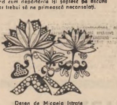
Desen de Micaela Istrate

Auzind cum depărtările își șoptesc pe oscumă că vor trebui să ne primească neconsolați.