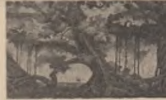
Zhang Zhongkang: „Poveste”

Dancează neaua pură-n aer și / danșază înlă-mi asemenea / acestor flori de nea călătorite. / Privese zăpada și-mi închipui că / e-n plină lăpede de primăvară. / Și ploaia mi-nchipui că se schimbă / în spice lungă de aur, nu în holde / Ci-n presimțirea unei bogății.