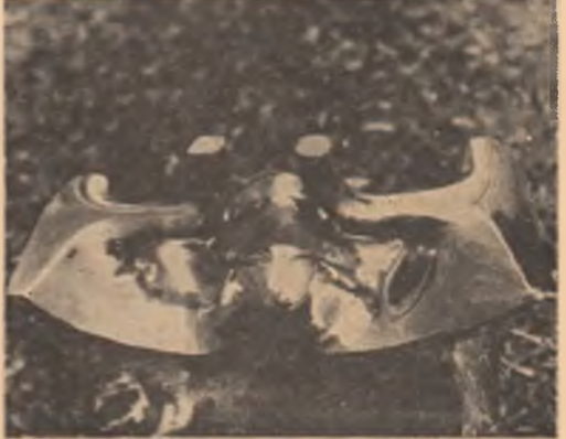
Tiberiu Bente : „Focu”

Ființa visurilor noastre Statuia albă a unui gînd !