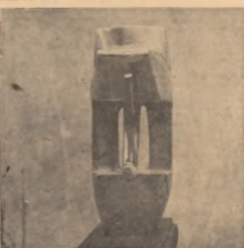
Tiberiu Bente : „Uma”

El nu pricep că, lăză să vreau eu les imnurile singure din lya cînd patria e sus, la apogeu !