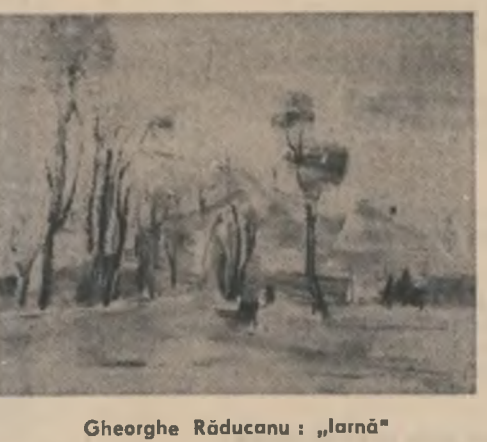
Gheorghe Răducanu: „Iarnă”