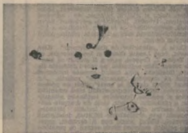
Desene de Raluca Grigorcea

cu acest roi de albine deasupra cuibului de rozamei