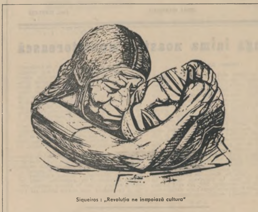
Siqueiros : „Revoluția ne înapoiază cultura”