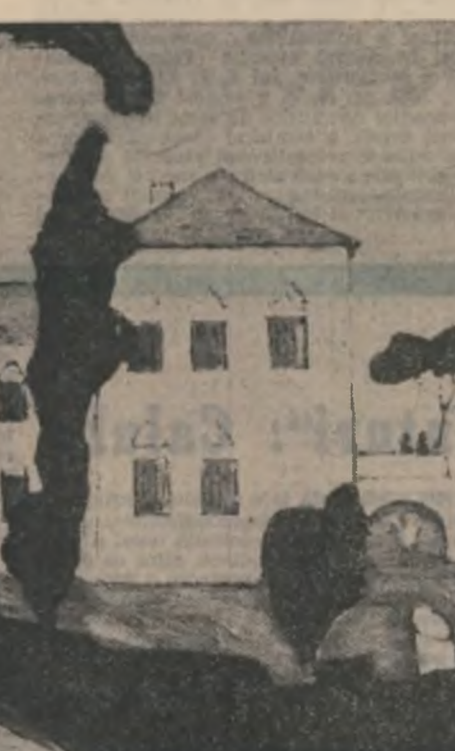
Spiru Vergulescu : „Portret (sus) ; „Casa lui Udrishte Năsturel (jos)”