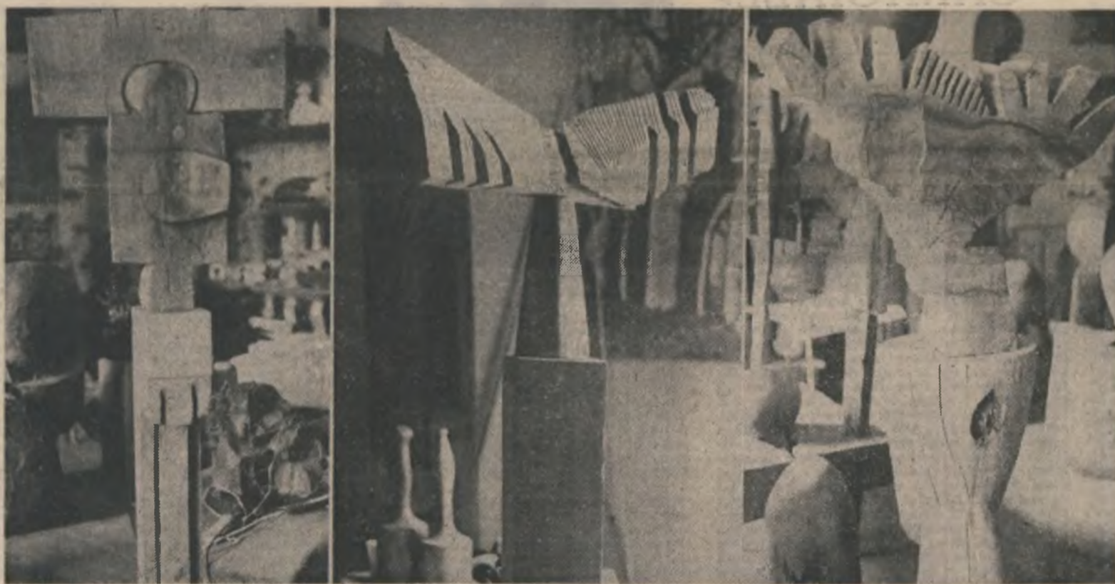
Sculpturi de Gheorghe Ilescu Căinești