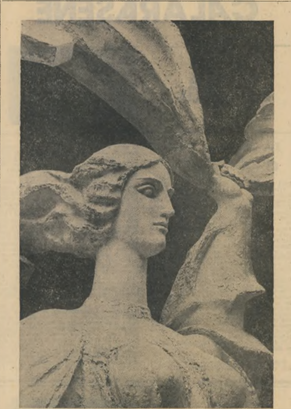
Sculptură de Gabriela Manole Adoc

De aici, din clădirea primăriei, din biroul primarului, privesc spre albia râului Mureș. Așa parcă nici nu mișcă, parcă doarme sau visează.