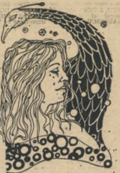
Desen de Nicolae Mocanu