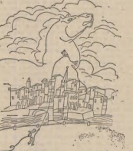
Desen de Mihai Vulcanescu