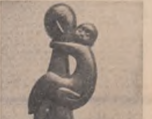
Ion Irimescu: „Maternitate”