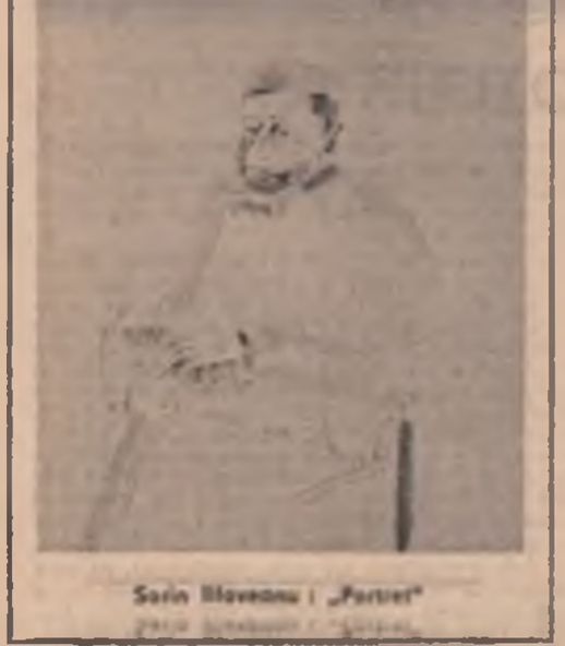
Scriitor suedez Artur