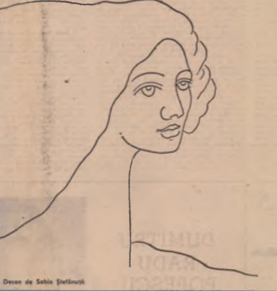
Desen de Sabina Șelbucă