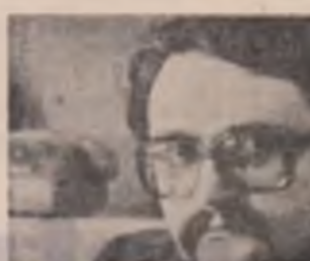
vinul ni-l ștergam cu pielea lar și vinul se-apînde prin venele noastre albaştrîndu-le SE-APRINDE

Cit de curățî sint cail șmulpi din ochii noștri SINT