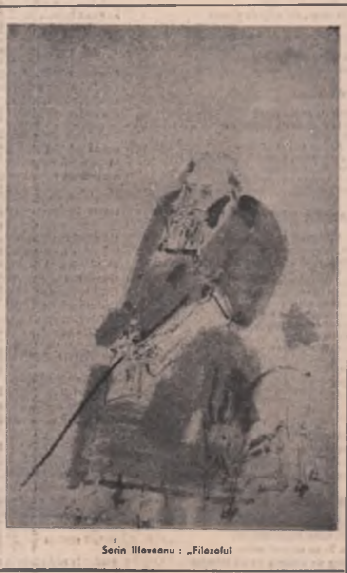
Șerif Ilievaanu: „Filozoful”

unde dealurile își ridică spinarea până la copitele cerbilor