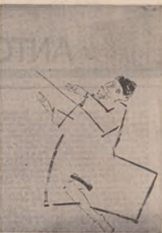
Desene de Sarin Ilfoveanu după „Hoții” de Akutagawa