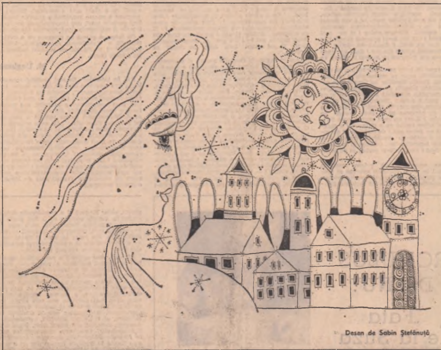
Desen de Sabin Ștefănuț