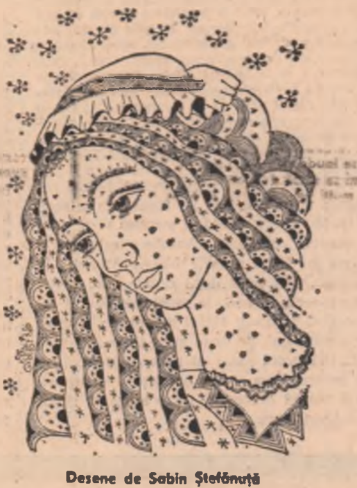
Desene de Sabin Ștefănuță