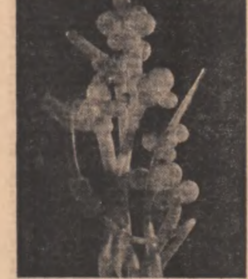
„Metamorfoză” de Dan Băncilă

S-a reintors în Coreea după ce la ei s-a terminat războiul.