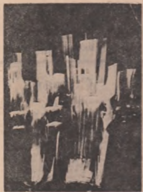
Sculptură de Constantin Lucaci

Apoi, dacă peste turmele răspîndite ochiul ghiceste un tremur mai adinc, mai mîhnit, toată neliniștea se potolește în păstori care cu sulul istovesc omeneasca neliniștea. (din Mitologie dei Sud - un Mitologie dei Sudului, Lecce, 1960).