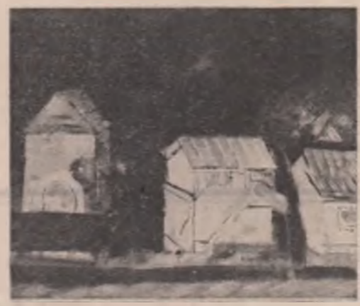
Ana Ruxandra Ilfoveanu: "Peisaj"