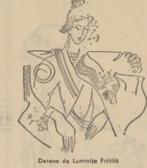
Desene de Luminia Frătăluț

În duminicile cu soare de vară, urba mureșeană, este desigur cel mai liniștit oraș al planetei. Toată suflarea validă, cu autobuzul sau clasic, apostolosește, se îndreaptă spre Week-end, adică, vorbit, Vichend. Aici, în nordul orașului, un brat al Muresului a fost captat într-o salbă de ștranduri cu plaje de... iarbă. De jur împrejur, instituțiile mai rentabile și-au construit vile de o soliditate și bun gust remarcabile. În aceste vile poș și bei cafea, bere, chiar și apă minerală, poș și jocul tenis de masă, se ascultă muzică. Aceste vile ale tuturor se numesc cit se