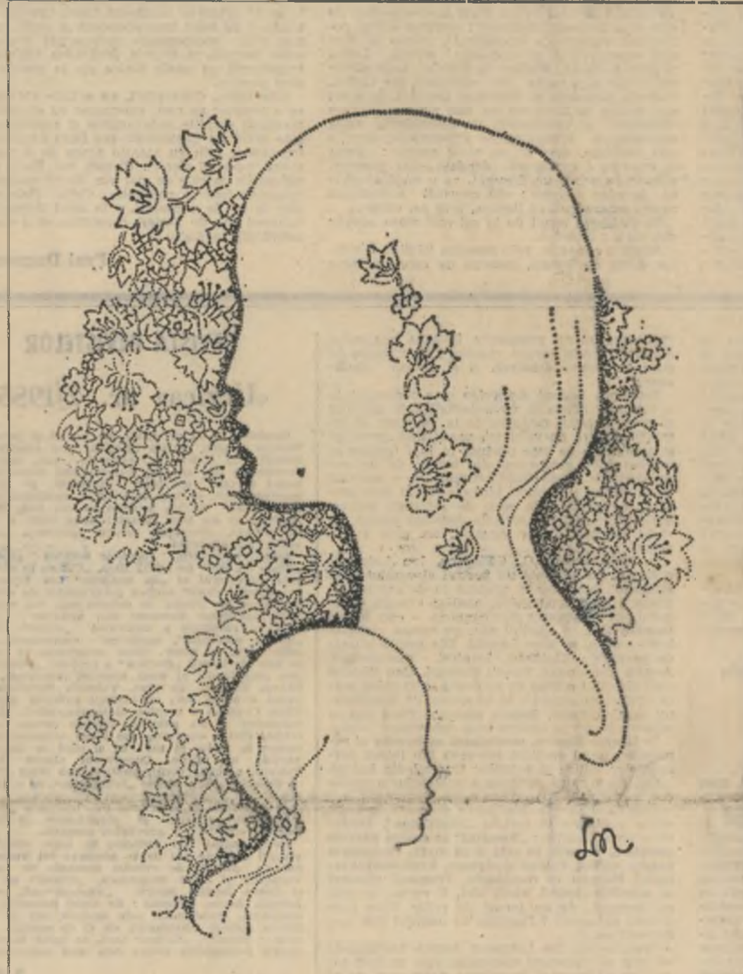
Desen de Liliana Niculescu