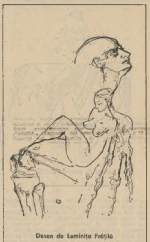
Desen de Luminița Frîțișă

Fragment din romanul -LEGAȚIVĂ CENTURILE DE SIGURANȚĂ-