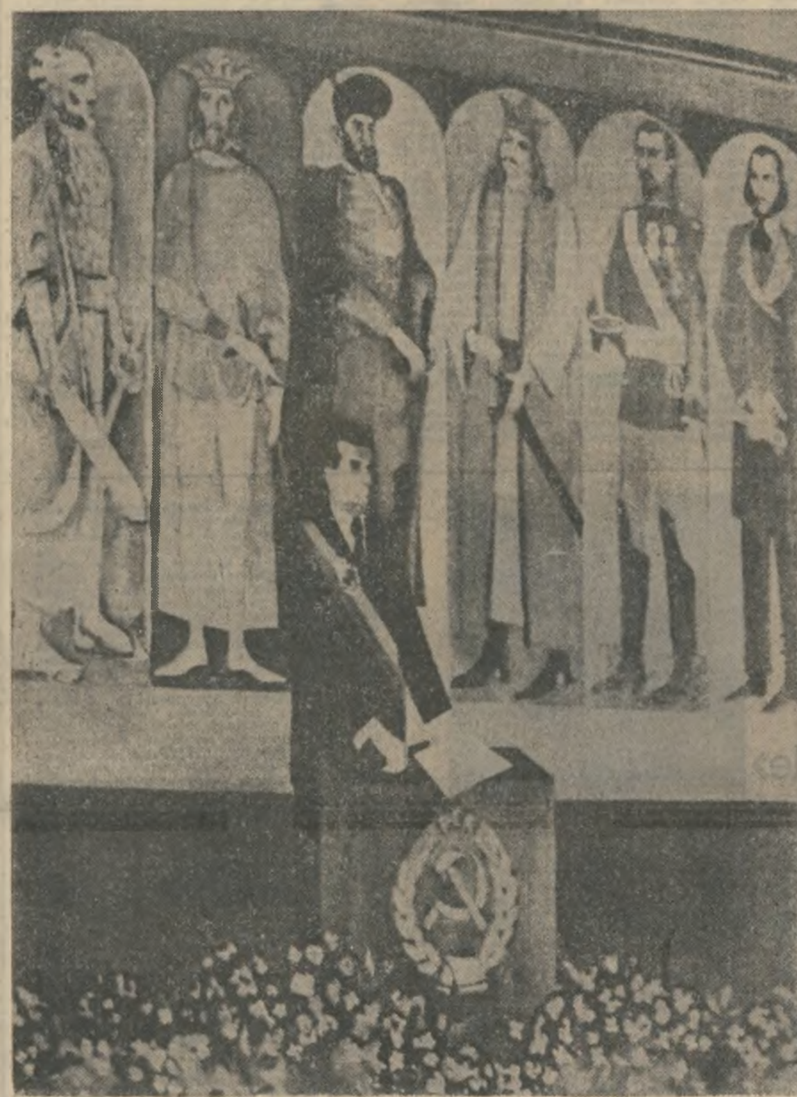
Tabloul de Constantin Piliuță

În paginile 4-5: ANCHETA «LUCEFĂRUL» DRAMATURGIA ACTUALĂ: COMPETENȚĂ ȘI VALOARE