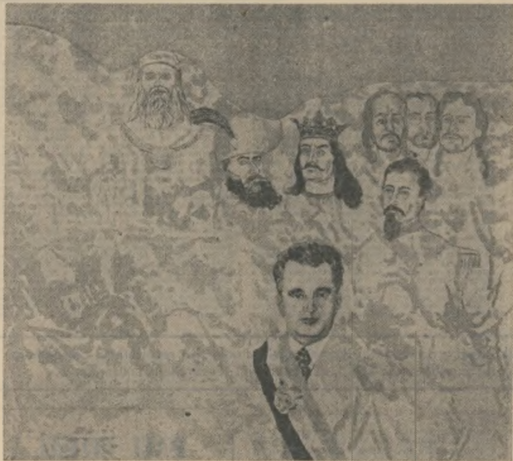
Tabloul de Eugen Popa