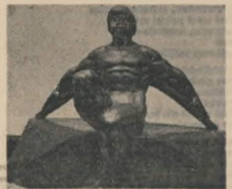
Ion Jalea : Arcaș odihnindu-se

lată insula spre care vine corabia fără de nume pe vînt și pe ape.