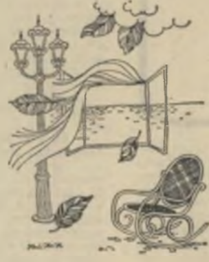
Desene de Florin Ilie

E poate un număr ascuns In privirea ta niciodată descifrată E poate o enigmă in Lacul acela Ce se cheamă adincul privirilor. E poate un zburcun între pleoapele tale Pe care eu nu l-am văzut îndeajuns. E poate o taină a ochilor tăi pierduți In privirea mea privindu-ți Ochi... ochii... Atunci cind orbim amîndoi Cufundîndu-ne în lucrul lacului acela adînc Ce-i spuneam cîndva iubire.