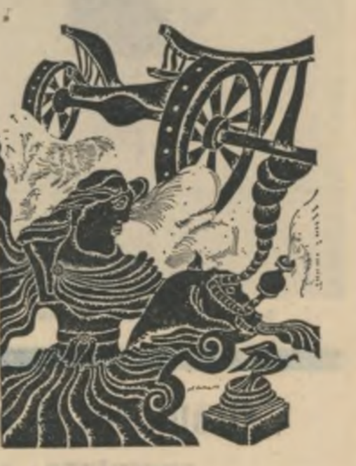
Desene de Gheorghe Bălan