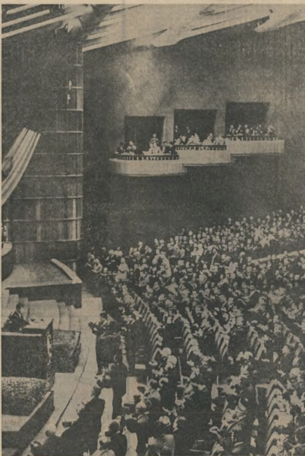
Tovarășul NICOLAE CEAUȘESCU la tribuna Congresului IX al P.C.R.