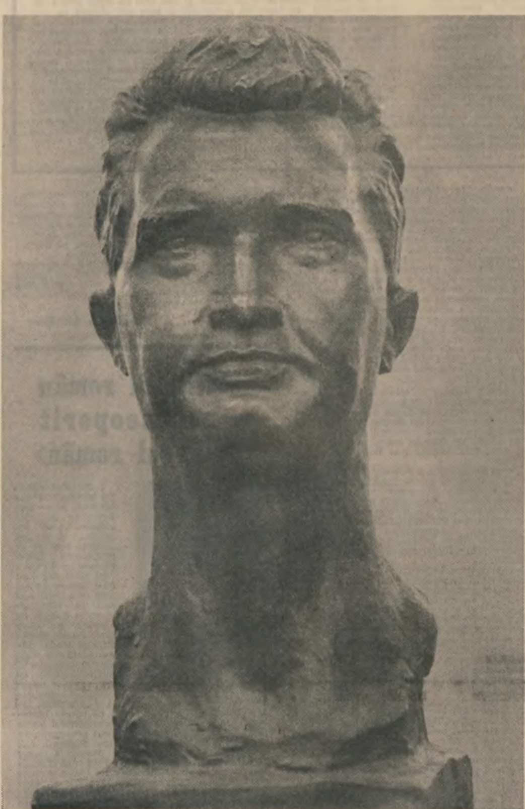
„Sintem revoluționari, subliniază secretarul general al partidului, și nu dorim opere care să intrumusezeze realitatea, să prezinte viața în culori trandafirii, nu avem nevoie de dulcagării artistice. Dimpotrivă, considerăm că o astfel de prezentare idealică a vieții este dăunătoare pentru dezvoltarea spiritului și a creativității revoluționare a omului socialist. Dar nu ne trebuie nici o artă care să nege realitățile, să le deformeze prezentându-le în negru, înfășurînd în culori cenușii viața și munca eroică a poporului nostru. O asemenea artă are, de asemenea, un caracter bolnăvicios și ea astăzi este profund dăunătoare”.

Intr-adevăr, cine urmărește mai ales publicistica, acei seismografi ai epocii, constată cu satisfacție că marile spirite ale momentului, în ciuda presiunilor, amenințărilor brutale și ostracizării s-au aflat înoliate în largul și ostracizării, democrație și patriotice, demascînd în fața opiniei publice substratul grupărilor terroiste, reacționare, periculoase spre care era împinsă, de mai multe decenii, în fondul de aur al literaturii universale. În acest sens, tovarășul Nicolae Ceaușescu precizează: „Un rol primordial în supraieșirea și dezvoltarea neîntrepruptă a poporului nostru pe multiple planuri au avut conservarea și îmbogățirea limbii, precum și creația artistică populară care a cizelat continuu graul strămoșesc, a cultivat virtuțile poporului, tradițiile înalte și obiceurile sale, l-au lărgit permanent orizontul de cultură”. Baladele, legendele, doinele, cîntecul haideucului, basmul alături de tradiționale realizări ale civilizației materiale „alcătuesc un inestimabil patrimoniu spiritual care oglindește în