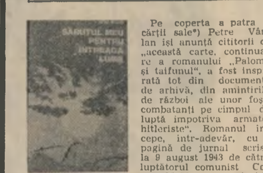
soare, cu o zi înainte de a fi executat împreună cu alți nouă tovarăși, iar acțiunea cărții se concentrează în jurul acestui jurnal — cinci caiete scrise în celula, recuperate de un gardian și aduse în textul cărții. În familia de țărani moldoveni Gelu Oprisor, eroul principal, își povestește viața de la acea execuție (cînd el singur scapă de moarte fiind salvat în ultimul moment de un grup de comunisti) pînă la găsirea jurnalului; el însuși grav rănit în război, pe frontul de vest, nu mai poate fi vindecat și se săvîrșește în toamna anului 1945. Este, așadar, un roman al morții pe care eroul a evitat-o miraculos în momentul execuției, pe care, grav rănit la cap, o prezintă pînă în clipa din urmă, împotriva cîreia luptă contra cronometrului pentru găsirea documentelor tovarășului său (ce se dovedește a-i fi fost frate) și pentru