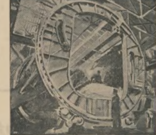
Vladimir Șerban: „Cîtiori ai noului timp”