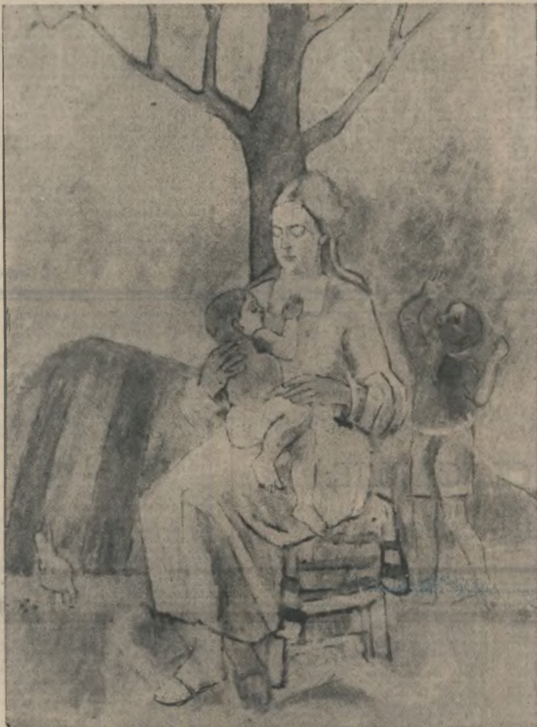
PRETUTINDENI SA FIE PACE — pictură de Constantin Andronic (Din expoziția de pictură, sculptură și grafică 18 ani de glorioase înfăptuiri revoluționare, deschisă în Sala Dalles)