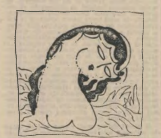
Desen de Dragoș Morãrescu

simetrie or advers, / Ca pe-un sãrut prin buze cel dintil, / Numind c-un degețel furnici și as- tre, / Ca tine, Bazã Tandrã, ce mingii / Nesã- tul prim al bucuriei noastre ! // Nimica nu-l in plus, nimic nu-l lest ! — / Heruv, sã-mi faci un INVENTAR CELEST !” Liric și lucid, poetul braveazã, mistificã, se rãstãrã in chip juvenil-provocator, dar stãruie intre aceea nostalgia tineretii, a prietenilor, a unei atmosfere pierdute, a iluziilor : „La masa- asta-au stat-cindva-alãturi : / Aho, Mărgãrit, Claris și Pucã — / Nepridicind cinci chelneri bravi s-aducã / Rom, boasã, votã — potopind desfãțuri ! / Vai, lemull meset — azi — cum se usucã / De gloria antanor omãturi ! / Cum ai purces, Frumoso, sã mi-l mãturi / Pe-acești Sileni cu hãmestitã bucã ? / La ora de inchi- dere, adese, / Mi-l mãtura hangãta de sub mese... / O surle, surle sãmbre-ale lui Gog-Magog : — „E ora de inchidere, vadã rog” // I-l mãturat, Hangã-Meș-Frumos ! / Ce pãrînți vei mãl avea — ca El — la Masã ? !” Superba tinerie