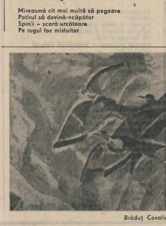
Brăduț Covăliu: „Zbor”