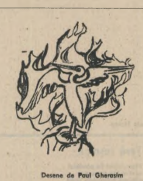
Desene de Paul Ștefănescu