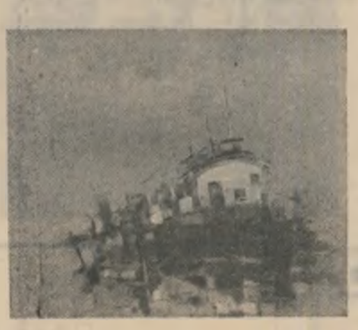
din favouri și risidii în larg. La imaginea predilectă a orașului, ce moare scriitorul sudează trecutul și viitorul, triada timpului putind intra încăpător în moarte.

Nu alta se arată lucrarea vremii în Bucuresci și el supuș năruirii, dacă nu atât de spectaculară tot pe alita de spornică și ineludabilă. Cum vedem, iscodirea se face meru pe din două, prezentul și rememorarea coincident două orase și fără să ne conformăm lui Frobenius rucnoaștem lesne, turnanța: complementară comita spațiu, ii e viața în tumult ca timp și viceversa. În plus, aceste categorii hotărâ intricate se pierzesc subiectiv după hohotirea personalului: Bucurescii ca spălu adversar ai „neprieteniilor”, iar Venezia sub efectul îndrăgostitului, orașul fenezic totale, așa cum magnifică o altă figură, Stelio Efrenna.