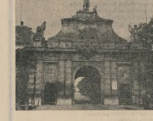
Muzeul Unirii din Alba Iulia

In sala om lină om, umăr lină umăr. In picioare, citeva scaune sint numai pentru mosnegi. In fundul sălii estrada conducerii de o parte, mai jos masa lungă a presei, de alta, cea a secretarilor.