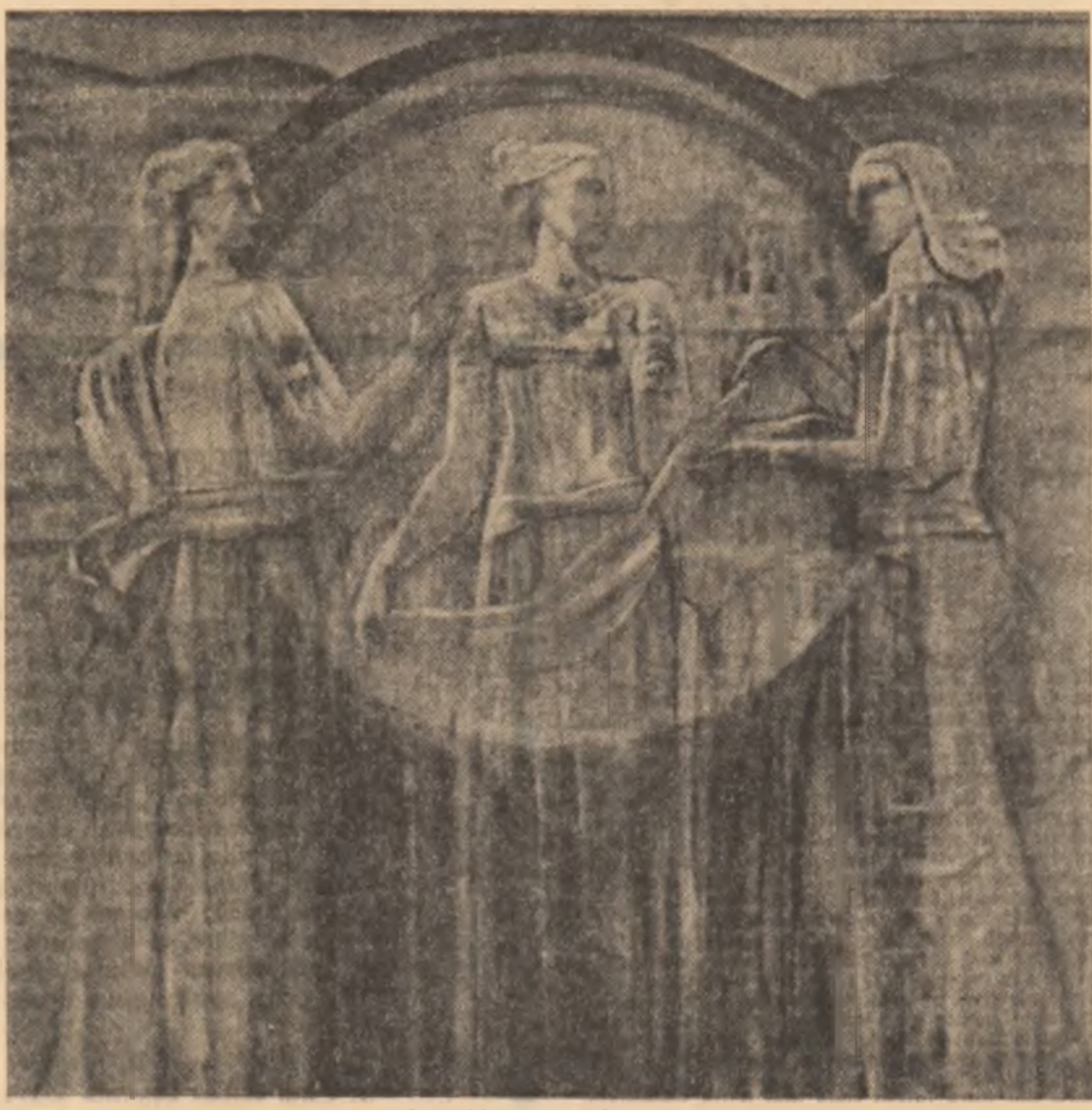
Geta Mermeze: „Surorile”