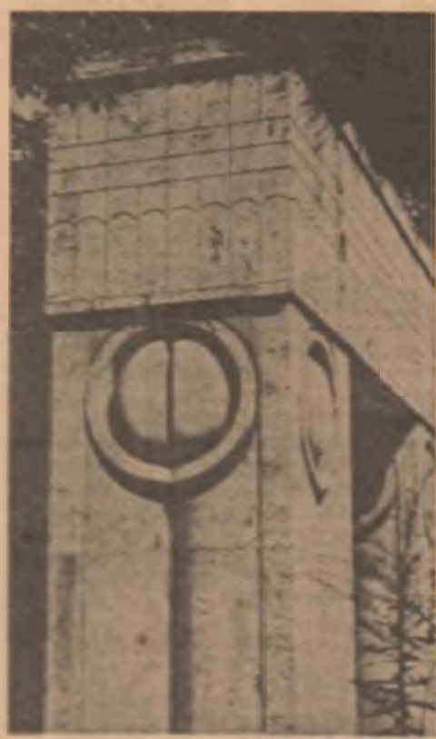
Constantin Brâncuși: „Poarta sântului”