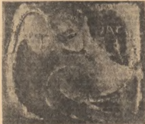
Rodica Pandela : „Adolescența”