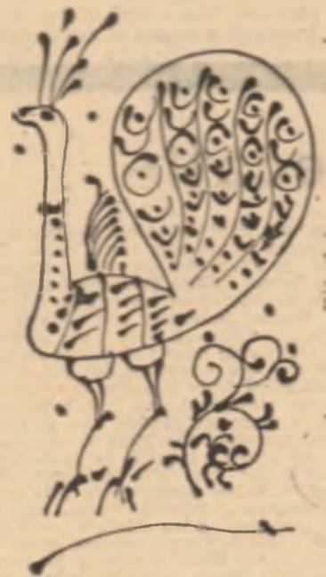
Desene de Sabin Ștefanuș