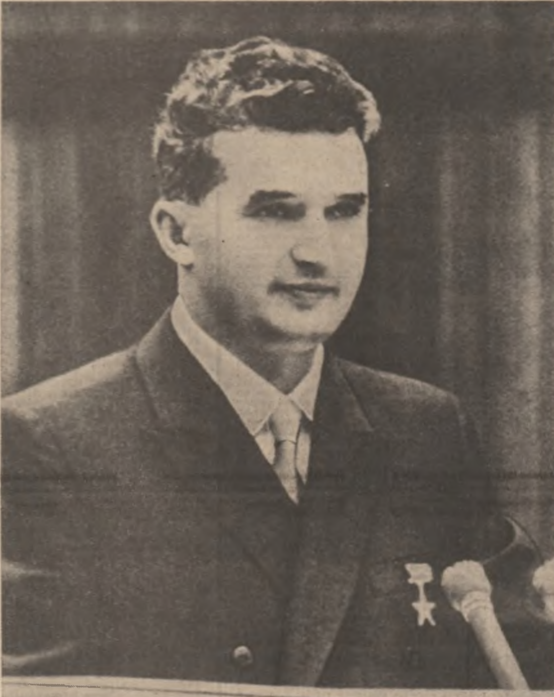
Tovarășul Nicolae Ceaușescu la tribuna Congresului al IX-lea al Partidului Comunist Român