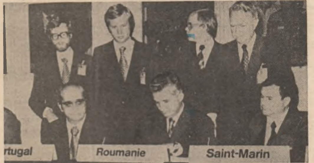
Tovarășul Nicolae Ceaușescu semnind Actul final al Conferinței pentru securitate și colaborare