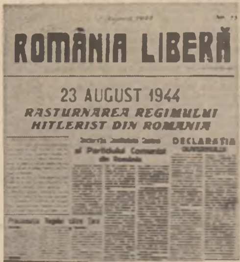
Primul număr legal al ziarului 'România liberă'