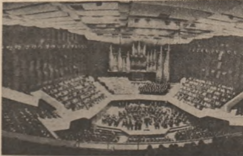
Noua sală de concert „Gewandhaus” din Leipzig