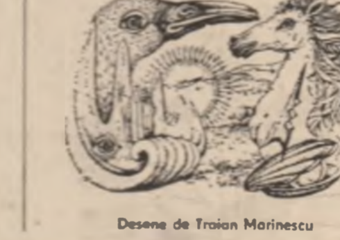
Desene de Traian Marinescu

e jîntului un zeu la care toți se închină.