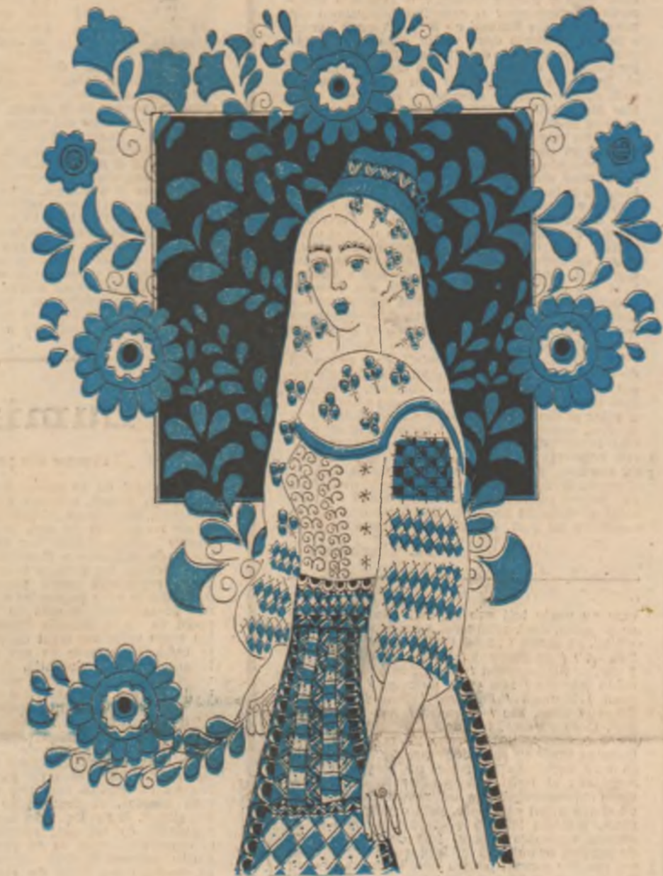
„Țărănească” — desen de Sabin Ștefanuț