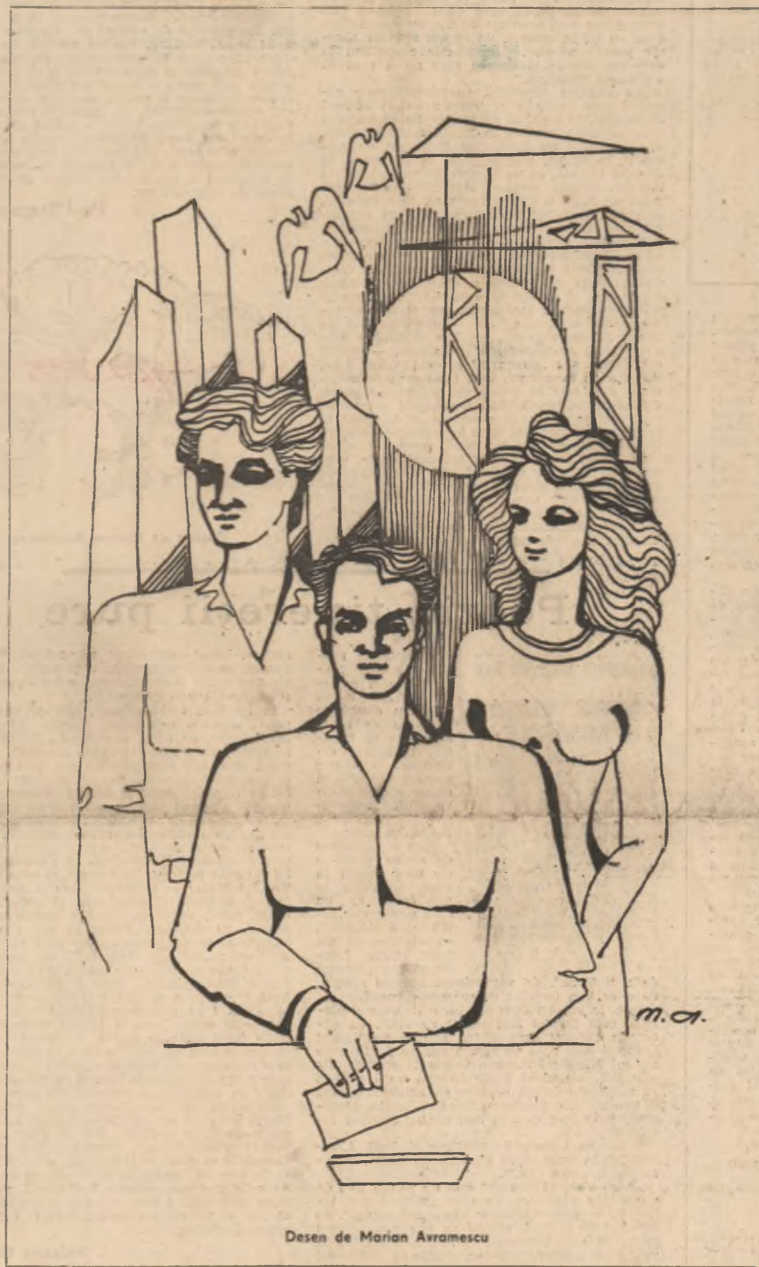
Desen de Marian Avramescu