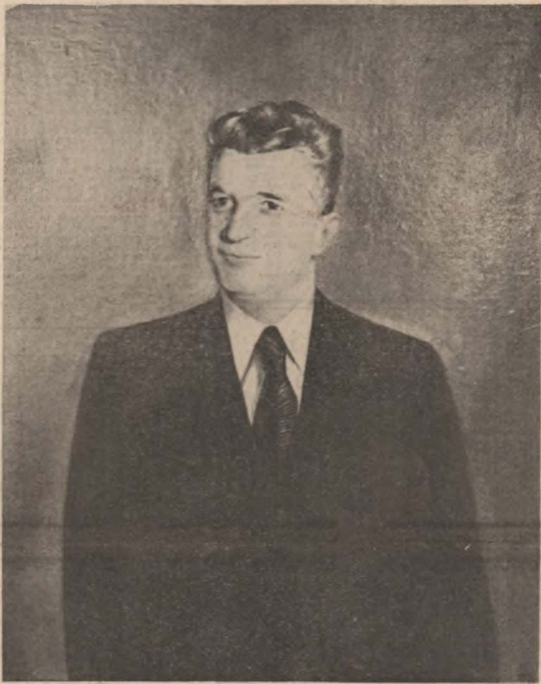
Tablou de Zamfir Dumitrescu