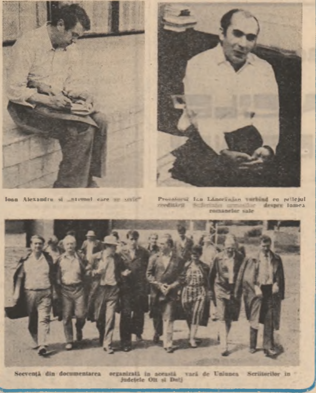
Seventă din documentarea organizată în această vară de Uniunea Scriitorilor în județele Ol și Dolj