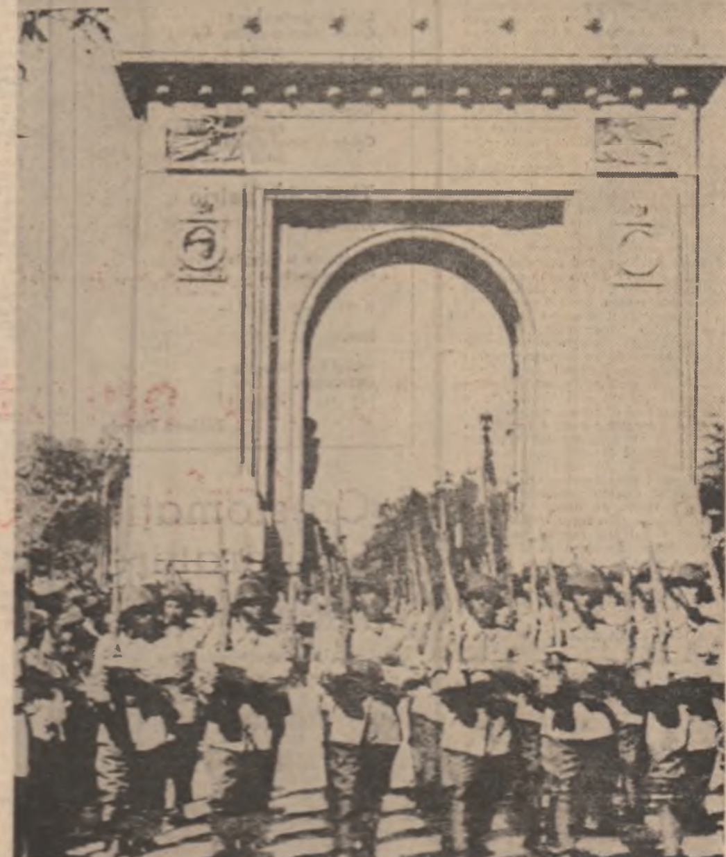
În măsura în care această era să pună, deșigur, pînă la marea acestor pe interesul național vital, fiind apel la națiunea noastră să se supună înaintea ei, să se supună la dominația hitleristă și la războiul împotriva ei. Este al bătă la adresa oligarhiei comuniste și antifasciste, al marelui război și al domniei hitleriste, alături de alți activiști de seamă ai partidului comunist.

În viața sa, a altor multor activiști de seamă ai partidului, de fapt în existența partidului comunist începea atunci o etapă nouă, hotărîtoare în felul ei și asupra destinelor României. Un loc important îl ocupă în opera tovarășului Nicolae Ceaușescu sublinierea faptului că — în condiția aspră a anilor premergători marii cottoiri de la 23 August 1944 — Partidul Comunist Român l-a revenit datorita de a suporta pe umerii săi principala presiune a imperatiivelor naționale excepționale. Meritul său esențial a constat în faptul că — în ciuda unor dificultăți numeroase și foarte greu de descris în puține cuvînte — și-a asumat voluntar misiunea istorică de a pregăti înfăptuirea revoluției de eliberare socială și națională antifascistă și antiimperialistă în România și s-a achitat cu cinste de această misiune. El a acționat din umbra ilegalității — timp de două decenii împlinite —, din sediul clandestin, dintr-o serie de verigi legale și semlegale în care se putea camufla din închisori și lagăre, chiar și din interioarele forțelor armate, oriunde reușea să-și constituie un cap de pod. În primul rînd, pentru a semăna vîntul de luptă, pentru a năvăli în țară împotriva lui, pentru a aduce în țară, a-l de temeiri precis conturate și logice, a o transforma în îndignare și apoi îndignarea în fapte de luptă! În al doilea rînd, pentru a contacta centrele de opoziție, a le ar-