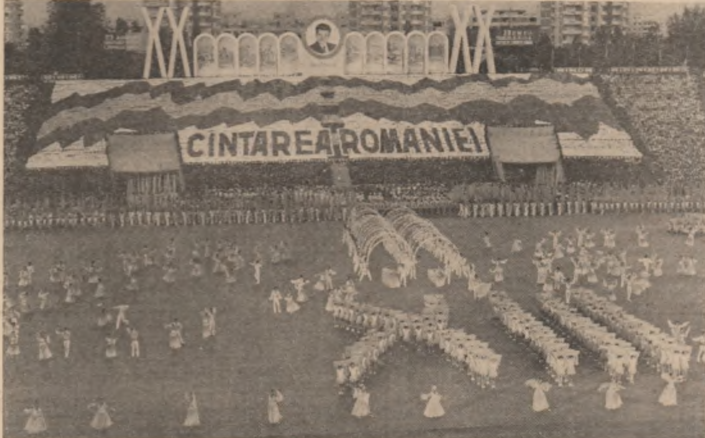
Imagini de la marele spectacol omagial de pe stadionul „23 August”