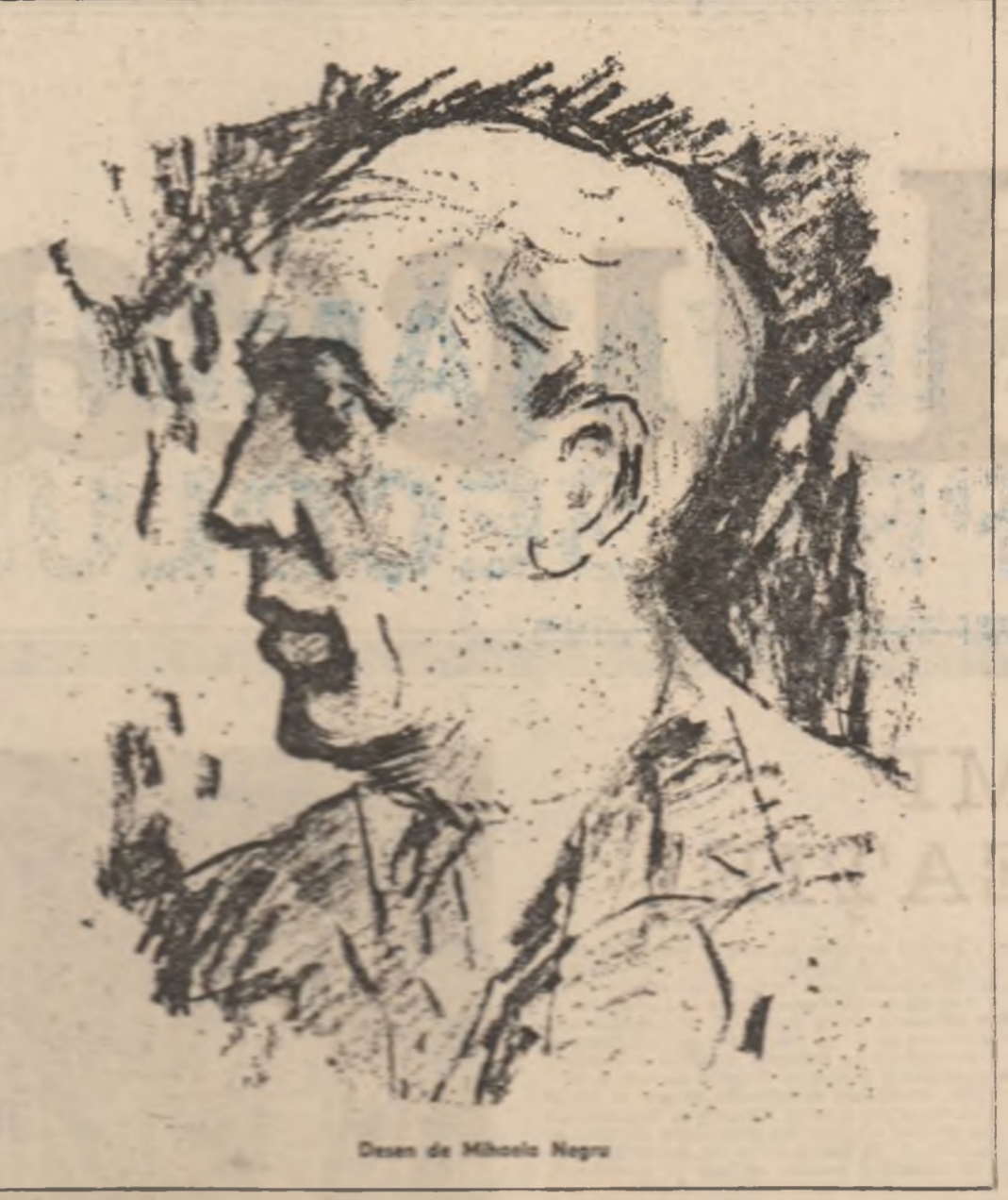
Desen de Mihail Negru