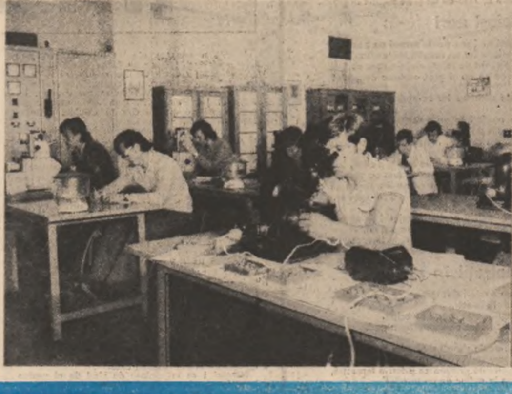
„Al născocitor pe-noctul unselele, cu care Ti s-a făcut mai diră voință și mai tare”