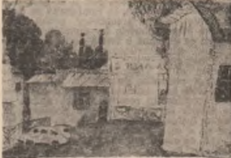
Dan Hatmanu : „Textila veche”

☆ ☆ pentru fanaticul profund sensul ser Om nu trece prin vreo catedrală