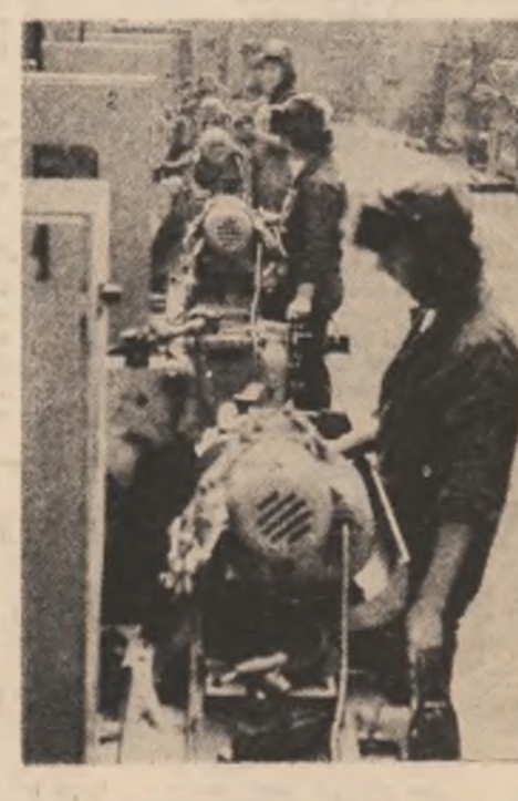
deoarece, în primul rînd, lărgirea, în întămînt, a paletrului obligatoriu de studii creșterea numărului de elevi și studenți — deși în licee și facultăți politehnice — au „produs” în ultima vreme cîteva milioane de subiecți care, antrenați în domeniile matematice, fizice, chimice, tehnologiilor industriale și-au păstrat prospecte și aptitudinile de cunoaștere, înțelegere și receptare așa zis umaniste.

În țara noastră, politica ultimelor două decenii a respectat tradiția mondială. Educația științifică și cercetarea au făcut un salt urias adaptîndu-se nevoilor societății, ceea ce poate crea impresia unui decalaj față de cultura care, obligată de infrastructura ei mai puțin dinamică, și-a continuat dezvoltarea mai lent. Impresie pe care însă realitatea nu o confirmă