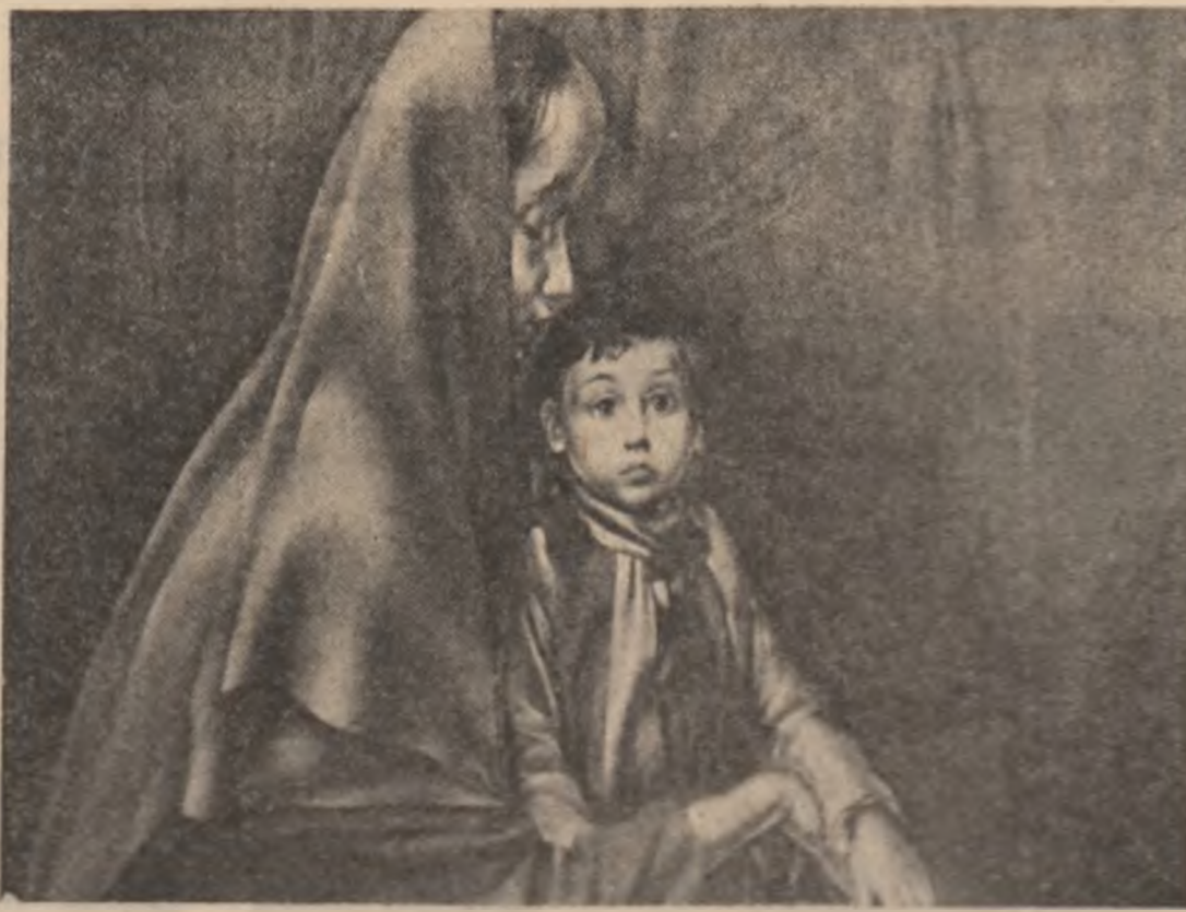
Tablouri de Eugen Bratolof (în paginile 5-8)

Rareori lucrurile se întrebau unde s-a făcut acea uită din care ieșeau să zboare pămîntul împovărat de fantasmă.