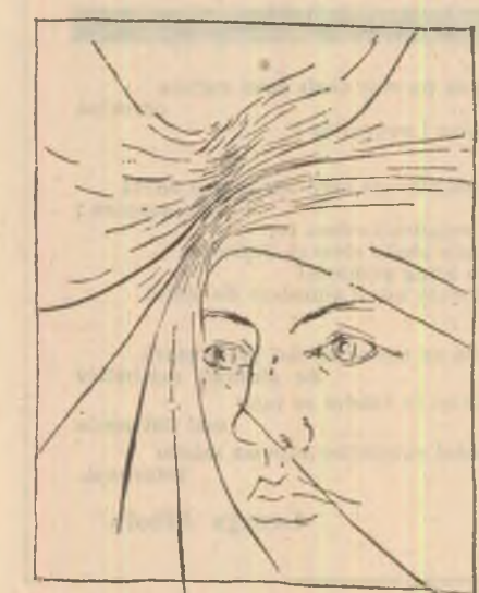
Desen de Maria Mocan