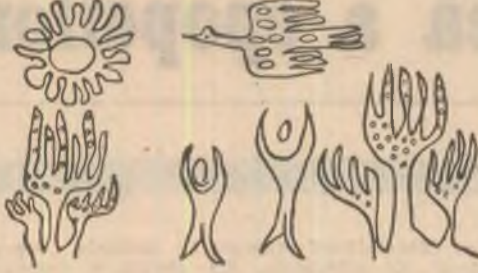
Desen de Nicolae Gadonschi