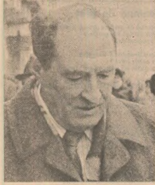
Prozatorul Constantin Chiriță semnează o nouă apariție editorială: „Romantica”