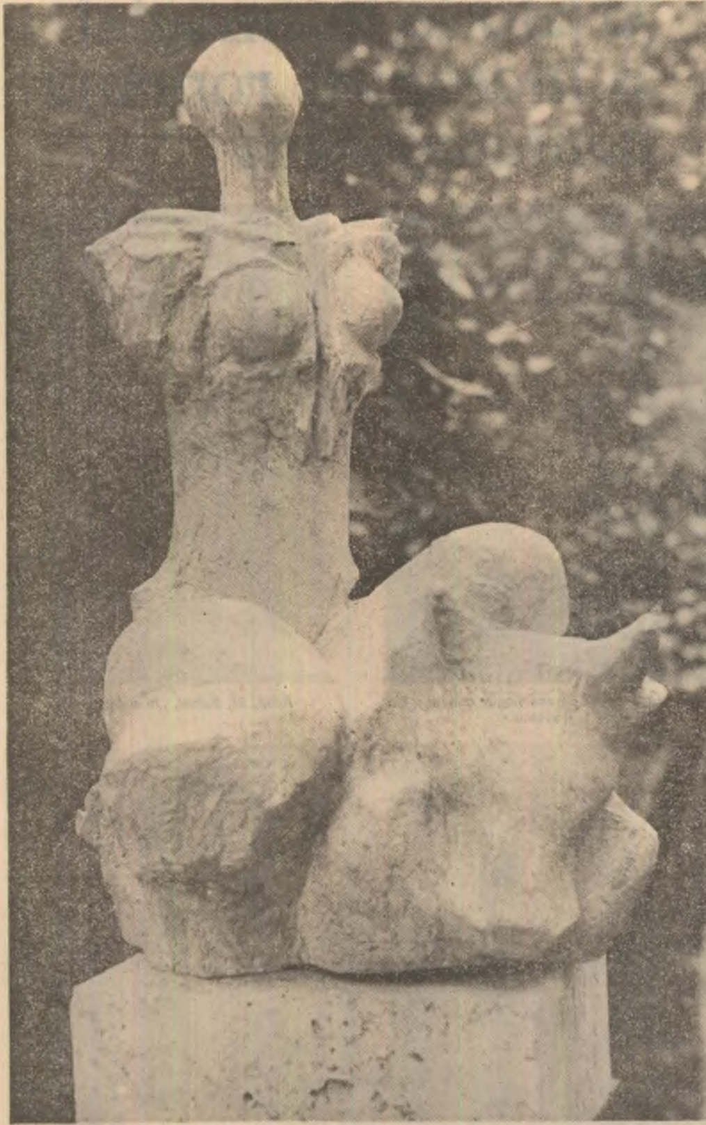
Valentina Boștină : „Răpirea Europei”

într-o zi nu vei mai găsi poteca spre casă vîntul va da foc pașilor singuri o șoaptă va zgîria viitorul copiilor cu obrazul decupat din fîntină imi voi luneca umbra amară într-o zi cînd n-o să mai fiu nicăieri mai puternic decît timpul voi fi neștiind despre arbori neștiind despre păsări în sfîrșit voi întrece singurătatea celor ce știu