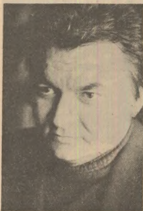
Un nume impus în sociologia culturii: Ilie Bădescu