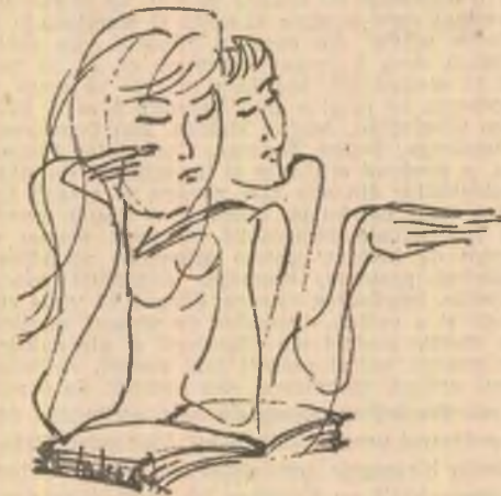
Ilustrații la volumul M. Eminescu : „Poezii” de Mihai Takacs

Doi ochi de copil, norocoși, adînci ca niște ere... Mii de muguri explodează. Nu se aude decît murmurul primăverii.