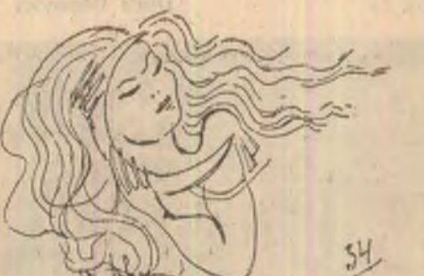
Desen de Mihai Tokacs