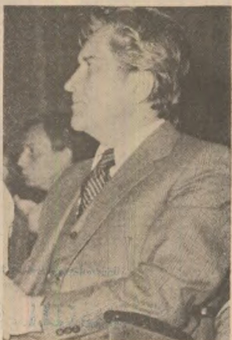
Acad. Al. Balaci, „la aniversară”