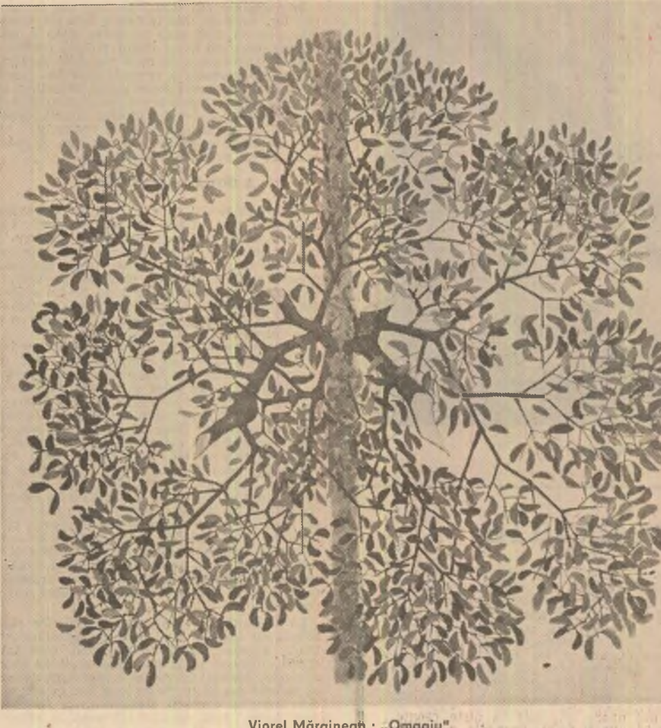
Viorel Mărginean: „Omăgii”