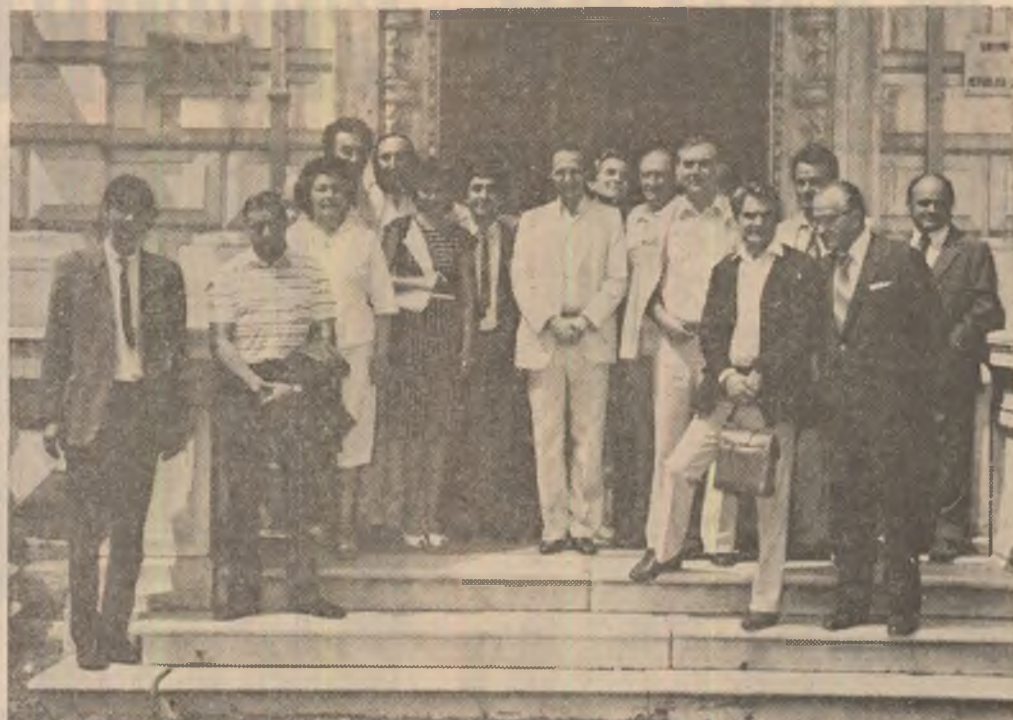
Scriitorii români împreună cu oaspeții lor din Iugoslavia, în fața Casei Scriitorilor „Mihail Sadoveanu” din București