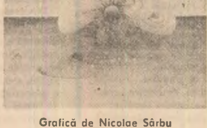
Grafică de Nicolae Sîrbu

În secvența Despărțirea de arhitect , aplicația cuvîntului la materie se consolidează. „Spațiul în care prind să se împlinească formele lui