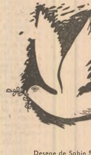
Desene de Sabin Ștefănuță

Încă mai cred că se poate Pune căpăstru la moarte Și-această planetă încă să fie Casa noastră pentru vecie