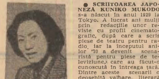
„nepoți”. În literatură a debutat în anul 1980 cu volumele de nuvele „Numele florilor”, „Vidra” și „Cușca cîinelui”, pentru care a fost distinsă cu cele mai importante premii literare japoneze...

mi împiedică să tac în minciună în fața echinoxului, în fața mea.