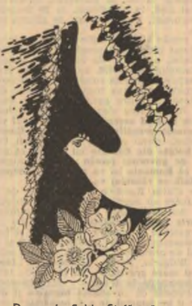
Desen de Sabin Ștefănuță