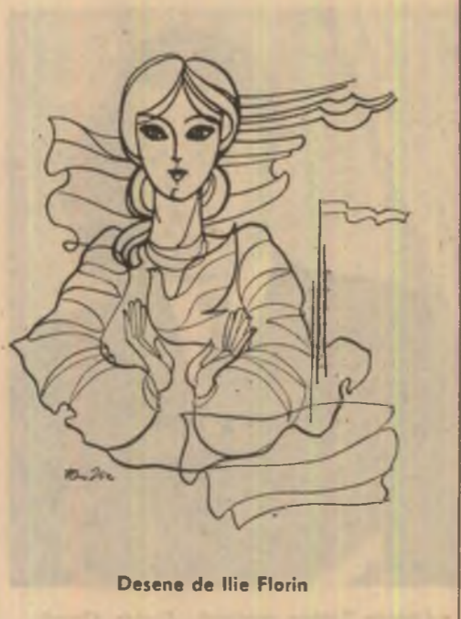
Desene de Ilie Florin

cu apă vie. Astfel, prins, între trecut și viitor eliberează-te din vis și ieși în calea florilor.