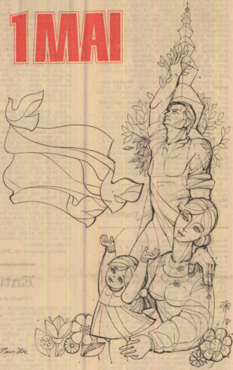
Ilustrație de Ilie Florin