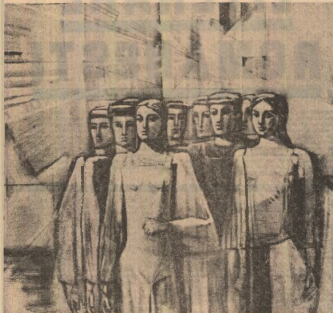
Geta Mermeze: „Constructorii”