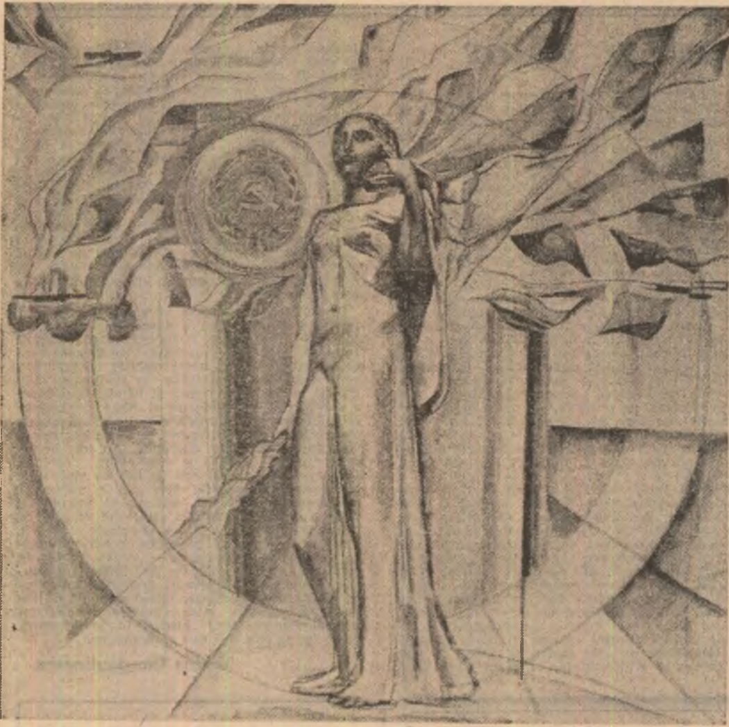
Geta Merzeze: „Omagiu”