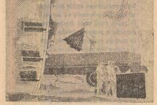
Ion Bițan: „Utilaj Greu”