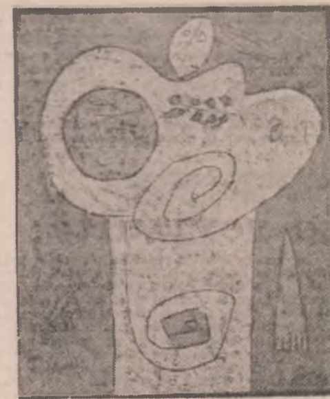
Restul e narațiune, sîrăcă invenție pentru putea înțelege, mai tîrziu, drumul spre esența sacrificiului.

Din nou în sat... Și dealul urias Imi pare un pitic trecînd pe uliți... Copilărie, unde pleci și-ți lași Cămeșă sfîrtecătoa în prea străine sulți?