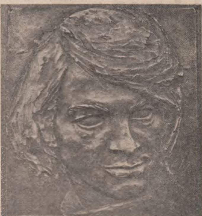
Basorelieful de Nicolae Kruch