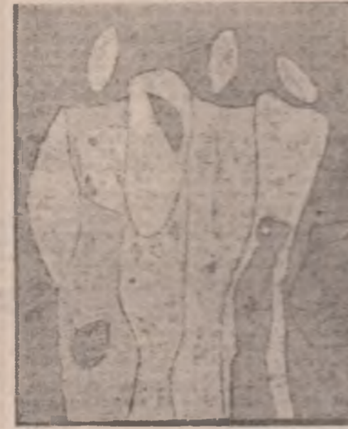
Xilografuri de Petru Petrescu (pag. 4 și 5)

și mă-ntreb dacă pe drumul peste care roți bucie au călcat sfîrîindu-mi gîndul, și pe care pasi aud, omu-i cel ce se arată, fiară-i umbra care trece, ori cenușa miazănoptii se coboară-ncet spre sud. dar hătoarele s-aproape, mîrgînind cu nepăsare în zăpezile calcate peste firele verzi, și pe maluri sălci pleacă pînă dincolo de zare cum înclină brate goale despre care-ai vrea să spui, și ta marginea comunii fumegă și-ndeamnă parcă în grămezi, gînoii putred ce așteaptă să-l arunci cu lopeți luat, în luna care stă ca o coșecă și-i aduce-ominte iarăși primăverile de-atunci. cite gînduri, cite umbre-n suferință vin de-avală peste-o foaie de hîrtie, cite-aud cum bat la uși,