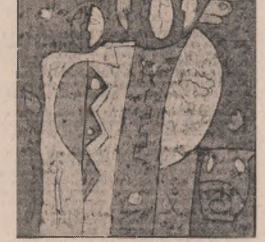
Restul e narațiune, sîrăcă invenție pentru putea înțelege, mai tîrziu, drumul spre esența sacrificiului.

De-aici, de sus, nu numai oamenii, dar și uriașele utilaje, răspîndite de-a lungul și de-a latul barajului ori urcînd pantele vîjeliș inclinate, ce suie către cotele lui cele mai înalte și, deocamdată, mereu provizorii, par niște puncte minusculi, aflate într-o perpetuă și im- previzibilă stare de agitație. Cu cîteva minute în urmă, instalații în cabina unei autobascu- late de săprize tone, pînă cu pietriș de riu, atacam și noi una din aceste pante tăiate chiar în trupul barajului, escaladînd parcă treaptă cu treaptă această piramidă inversă, cu vîrful în- fîpt în albia de granit a Buzăului.