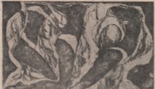
Grafică de Adriana Bodeanu