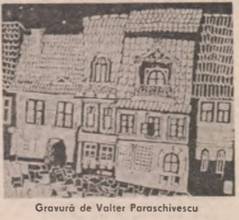
Gravură de Valter Paraschivescu

3 Dar au fost și nopți adevărate cînd pîrul tîu știa să ingine apele mării, iar trupul îți mirosea ca un rosmarin, astfel că nimic n-am să uit din această viață, nimic n-am să uit din tot ce-am trăit;