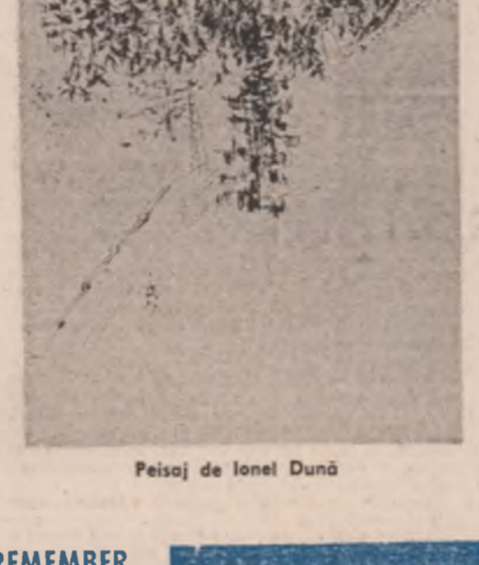
Peisaj de Ionel Dundu