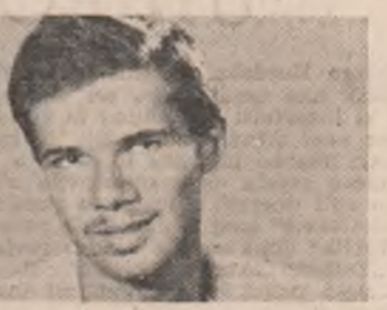
Ochii mei în fața zborului ei ușor două clepsidre sînt pe vînt.