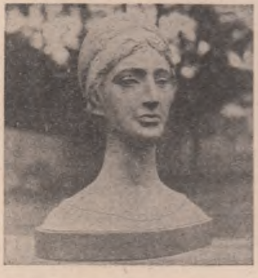
Nicolae Kruch: „Portret”