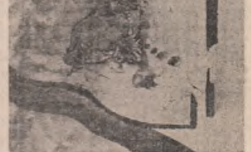
Ileana Dăscălescu: „Valea Soarelui”

Înima în bucăți ca frânturile De trafic pierdute în ploaia Albastră confuză strigătul Se zbate cu aerul din plămîni